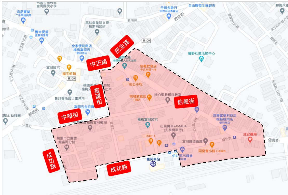
楊梅富岡火車站周邊範圍圖